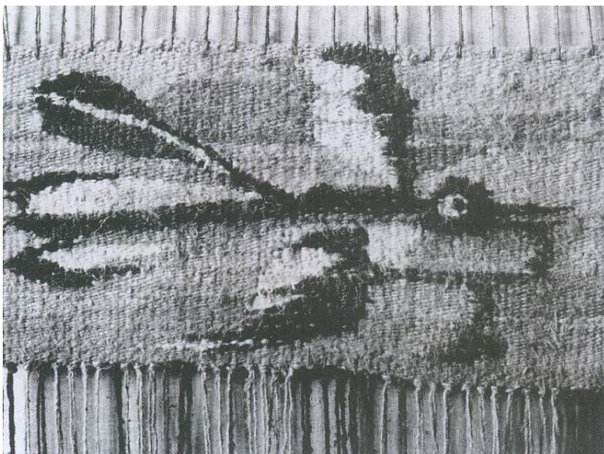
Гобелен «Сорока». Ручное ткачество, пенька, 50x100 см